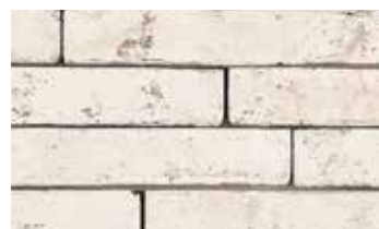
Imperium albius "Iluzo"