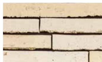
Wasserstrich spécial blanc